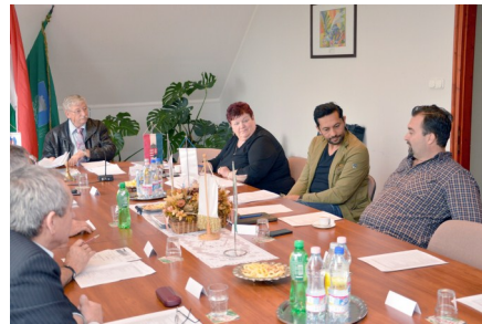
Társulási ülés Bodán