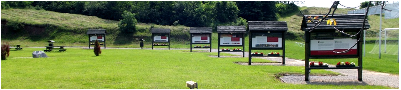
Boda - Információs Park