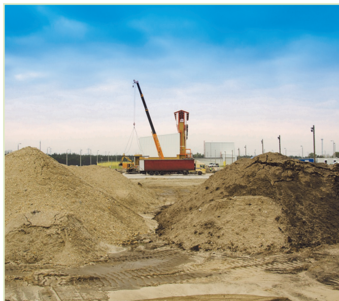
A talajcsere után rögtön elkezdték az új modul építését

Feszített ütemben, de határidőre, május 31-re elkészült a