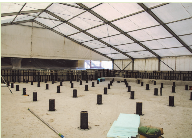
A sátor alatt télen is tudnak dolgozni

A durva tereprendezés során mintegy 27 ezer köbméter anyagot kellett megmozgatni, mely részben a helyben kitermelt, részben a paksi Mária-bányai anyagból tevődött össze. A megfelelő tömörség ellenőrzését követően terítették az újabb 25 centiméteres talajréteget hagyományos hengerléssel. Így alakult ki a végleges terepszint.