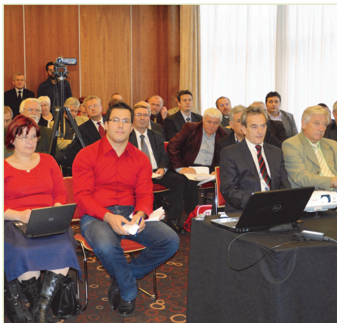
A sajtótájékoztató résztvevői

A bátaapáti Nemzeti Radioaktív hulladék-tároló (NRHT) felszín alatti létesítményében év végéig 3249 hordó atomerőműből származó kis és közepes aktivitású hulladék került betonkonténerekben a végleges helyére. A már meglévő két tárolótér mellett zajlik a 3-as és a 4-es kamra kialakítása. Több éves fejlesztési program eredményeként az RHK Kft. 2014-ben engedélyt kapott egy olyan új hulladék-elhelyezési rendszer bevezetésére, amely a tárolókamrák kihasználtságát közel a duplájára növeli. A világszínvonalú létesítményre továbbra is sokan kíváncsiak. A hazai látogatók mellett külföldről főleg szakemberek érkeznek tapasztalatcserére.