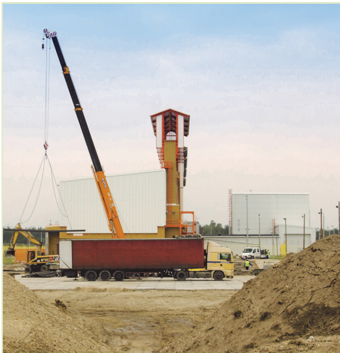
Az új kamra építési munkálatai

A paksi atomerőműben elhasznált fűtőelemeknek az atomerőmű szomszédságában található Kieégett Kazetták Átmeneti Tárolója nyújt biztonságos elhelyezést. Itt je-