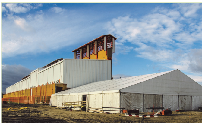
Sátrat húztak, hogy folyamatosan dolgozhassanak

A paksi atomerőmű robusztus blokképületeihez mérve szerényen húzódik meg annak szomszédságában a Kiégett Kazetták Átmeneti Tárolója. A sárga színű, modulokból álló, 10 emelet magas épületegyüttes (a KKÁT) az elhasznált fűtőelemek legkevesebb ötven éves átmeneti tárolására szolgál. Üzemeltetője a Radioaktív Hulladékokat Kezelő Közhasznú Nonprofit Kft.(RHK Kft.), melynek egyik kiemelt feladata, hogy a létesítményben mindig elegendő hely legyen az ide átszállított, elhasznált üzemanyag számára. Most a legújabb tárolókamrák építésének előkészítéseként befejeződött a talajcsere a kijelölt területen.