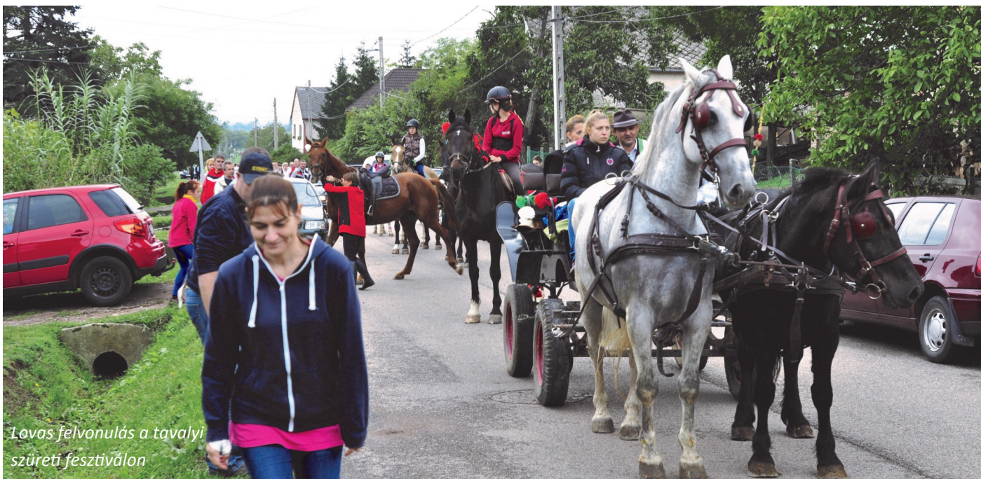
Lovas felvonulás a tavalyi szüreti fesztiválon

Húsz éves az NYMTIT - Tájéoló Nap és Szüreti Fesztivál