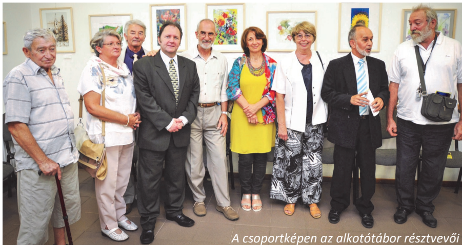
A csoportképen az alkotótábor résztvevői

- Hasonlóan a korábbi évekhez, meglátogattak bennünket a helyi iskolások, és idén még az óvoda lelkes csemétéi is kipróbálták velünk a közös alkotás örömeit.