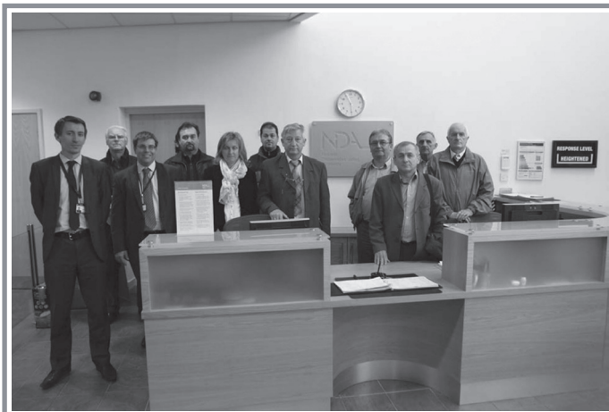
A nyugat-mecseki küldöttség hasznos tapasztalatokra tett szert júniusi, angliai szakmai útja során