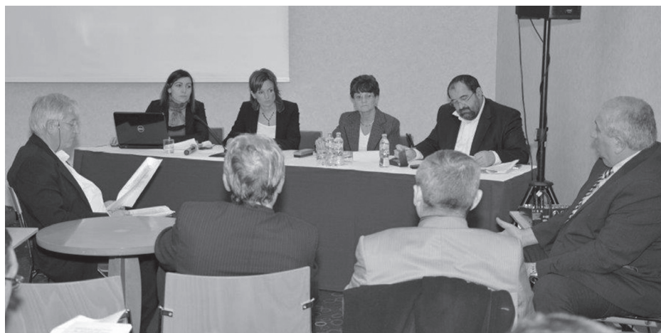
A sajtótájékoztató után a térségi társulásoknak is alkalmuk volt átbeszélni közös feladataikat