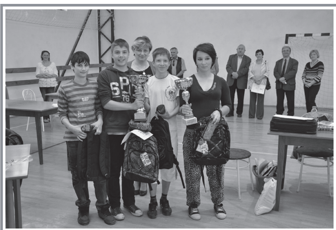
A már hagyománnyá vált hetveheyi Niels Bohr fizika és kémia versenyen Boda csapata diadalmaskodott