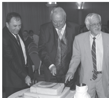
Az ünnepség elmaradhatatlan tartozéka volt a születésnap tortája is