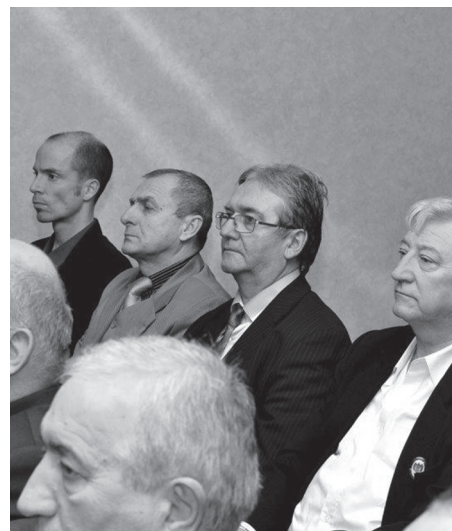
Az NYMTIT-et is többen képviselték Budapesten