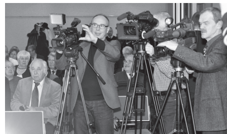
Az évzáró sajtótájékoztatók mindig élénk sajtóérdeklődés mellett zajlanak