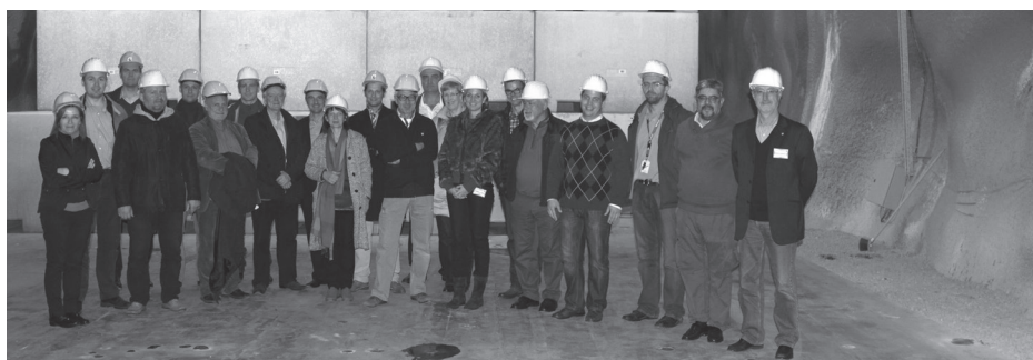
Bátaapátiban az impozáns tárolókamra is kitérta kapuit a látogatók előtt

November 4-6. között hazánkba látogattak az európai radioaktív hulladék-kezelő társaságok vezetőinek egy csoportja. A „Club of Agencies” tagjai először az RHK Kft. által szervezett budapesti tanácskozáson vettek részt, majd egy szakmai út keretében meg-