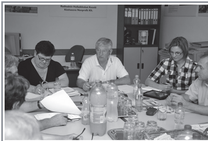
A társulási ülések alkalmával rendszeresen lehetőség van megvitatni a térséget érintő feladatokat