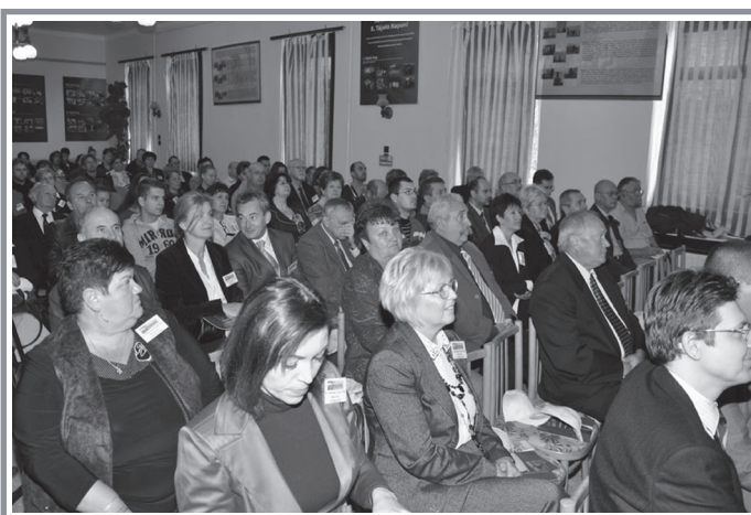
A jubileumi Tájéoló Nap nagy érdeklődés mellett zajlott, a tudományos tanácskozáson is telt ház volt