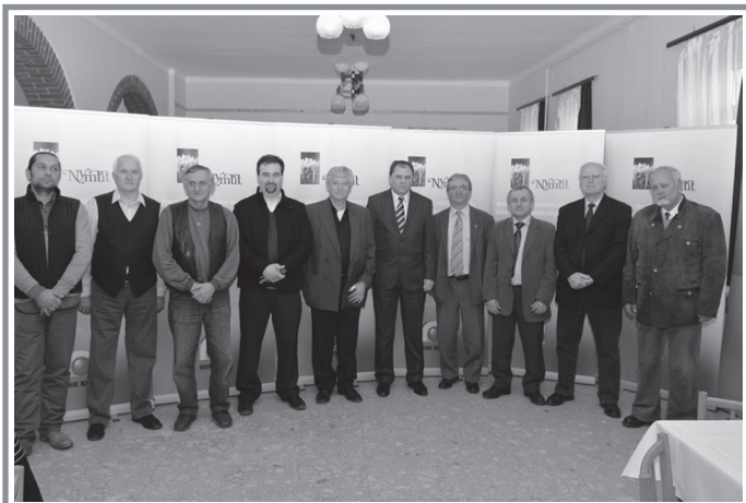
A tagtelepülések polgármestereinek összefogása a lakosság érdekeit szolgálja