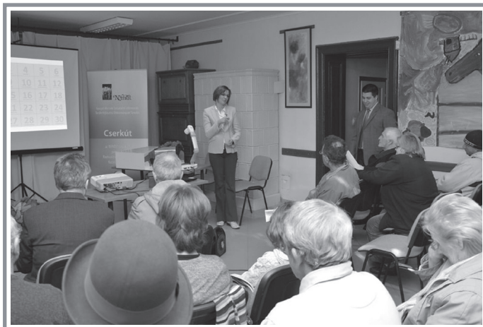
Az év eleji tájékoztató körút alkalmával, az RHK Kft. szakemberei minden érintett településre ellátogattak