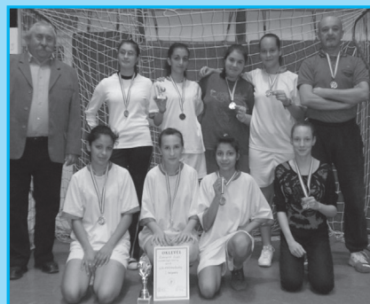
Az összefogásnak köszönhetően újraéledt a labdarúgó torna, amelyen már a hölgyek is megmutathatták játéktudásukat

házi sakkbajnoksággal is bővítik az iskolai versenyek sorát, melyet az ez esetben is támogatást nyújtó szervezetről, Zsongorkő Sakkbajnokságnak neveztek el.